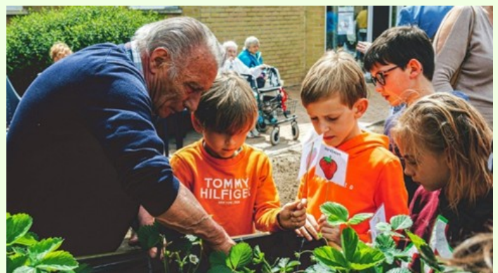
Generatietuin Anzegem

Bekijk in aanvulling op dit project ook de brochure generatietuinen van Good Planet.