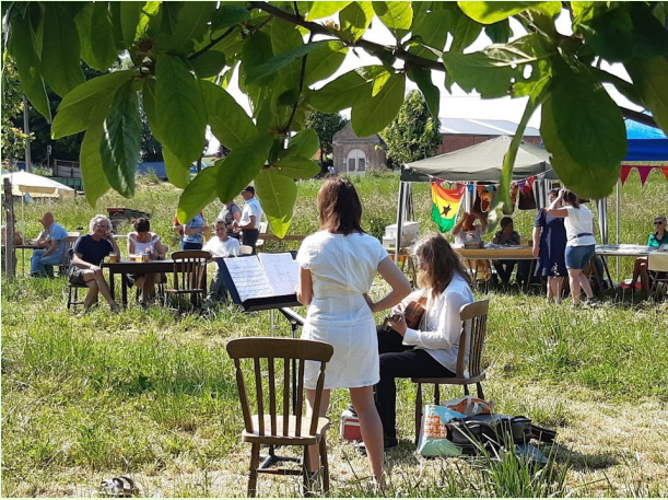
Feestje in Onzen Hof in 2023

Bekijk ook de website van Kumtichcomité vzw.