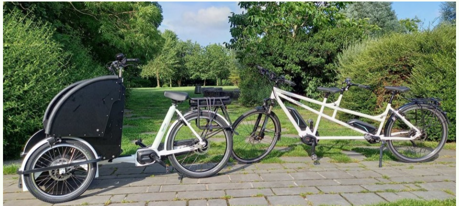
Deze deelfietsen zijn gratis uitleenbaar in het Buurtsalon in Krombeke