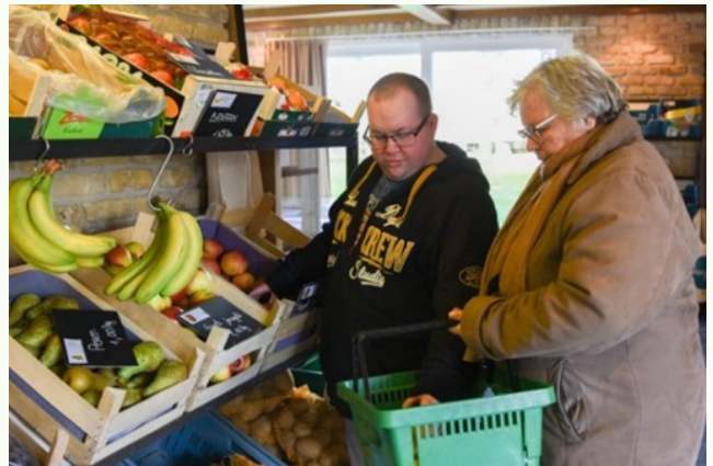
Dorpspunt Beveren

Op termijn wil De Lovie hier nog de dienst 'circulaire economie' hieraan toevoegen.