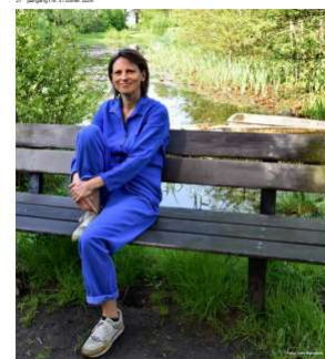
blz. 9 Vrienden van de Begijnenakker