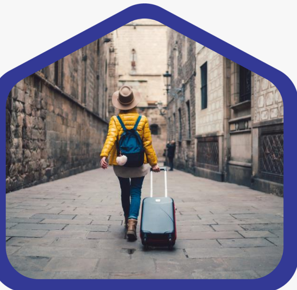
Locatiebezoek en lokale werkgroep