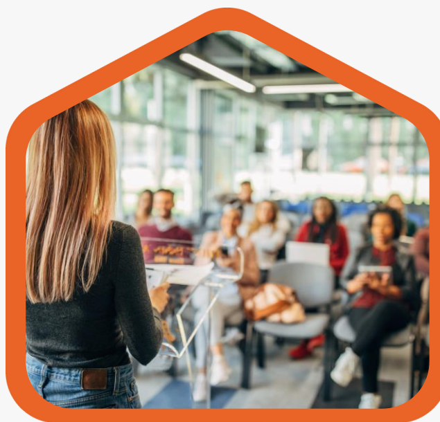
Toelichting project op de gemeente

Toelichting project gemeente Conclusie: gemeente is eigenaar en wordt beheerder (wegens fusie kerkfabriek) Next steps: bespreking op managementteam, duidelijkheid huidige gebruikers, toekomstplan beheer, reservatiesysteem, sleutelbeheer