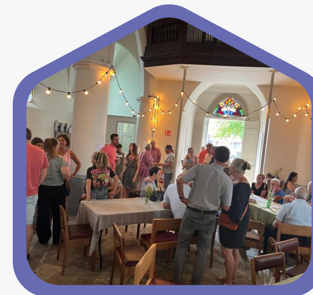
Opstart buurtcomité en eerste activiteit

Actiecomité Aanspreekpunt gemeente Kerk als locatie Communicatie over toekomst project via infodoeken