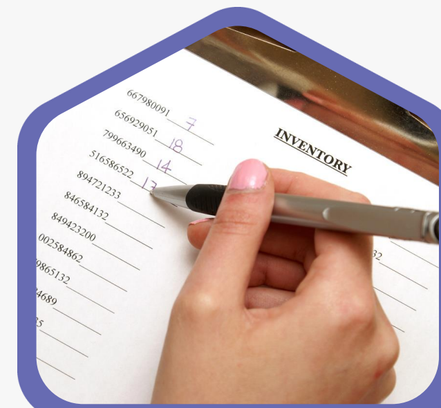
Inventaris van (noden) huidige gebruikers

Toelichting project gemeente Conclusie: gemeente is eigenaar en wordt beheerder (wegens fusie kerkfabriek) Next steps: bespreking op managementteam, duidelijkheid huidige gebruikers, toekomstplan beheer, reservatiesysteem, sleutelbeheer