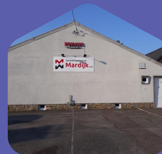
Molenbeek-Wersbeek OC Mardijk