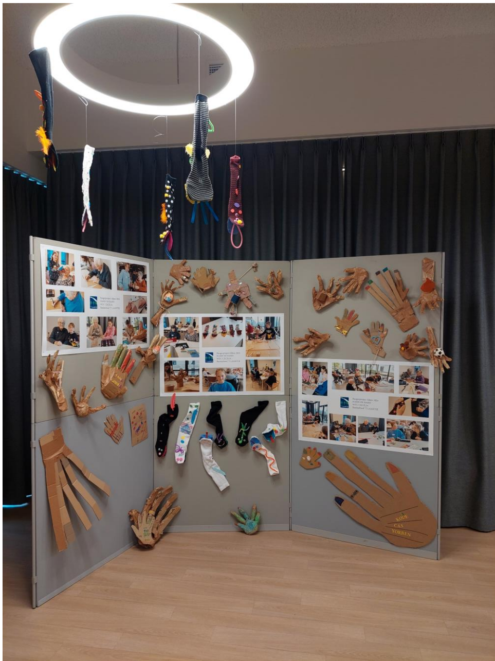
5 oktober 2024 - Dorpsbelangen