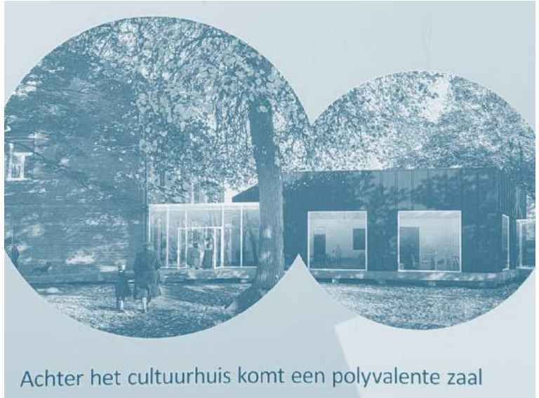
Achter het cultuurhuis komt een polyvalente zaal